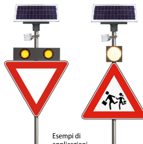
Esempi di applicazioni Safety Radar Solar box